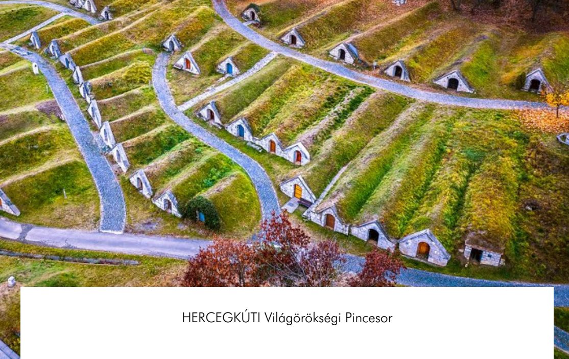
HERCEGGÚTI Világörökségi Pincesor

Minden tokaji látogatás fénypontja a bájos és lenyűgöző kis sváb falu, Herceggút és annak egyedülálló pincerendszere.