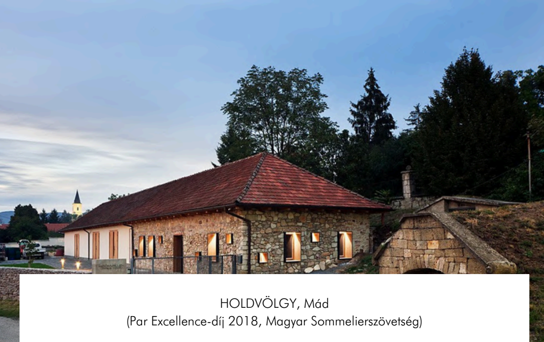
HOLDVÖLGY, Mád (Par Excellence-díj 2018, Magyar Sommelierszövetség)

Fedezze fel Tokaj-hegyalja többszörösen díjazott (VinCe Awards 2016; 2017) történelmi pincerendszerét a HOLDVÖLGY birtokon! Több száz éves járatok, közel 2 km hossz, 109 ág és 3 szint egyedülálló komplexuma várja a látogatót a 2018-ban építészeti design díjjal kitüntetett borászati épület alatt! A HOLDVÖLGY birtok egy kis parcellából született, melyet a tulajdonos édesanyja ajándékozott annak idején férjének születésnap ajándék gyanánt. A tulajdonost a Tokaji Borvidék egységisége és a benne rejlő lehetőségek valósággal lenyűgözték: a birtok mára 27 hektárra nőtt (2019) és minden parcellája történelmileg klasszifikált dűlőben fekszik.